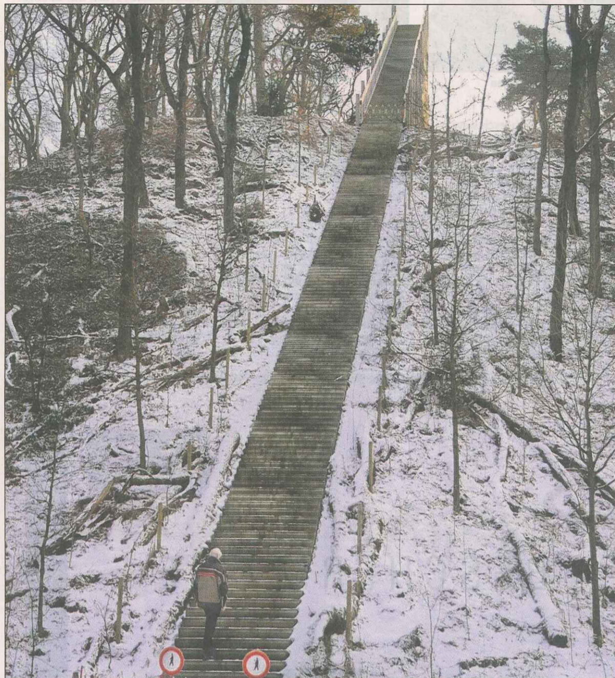
Kijk uit , kunstwerk van Krijn Giezen, sinds voorjaar 2006 voor publiek gesloten.

In mei 2006 – Kijk uit was een paar maanden open – brak een 17-jarige scholier uit Wapenveld bijna zijn nek toen hij halverwege de trap zijn evenwicht verloor en en der-